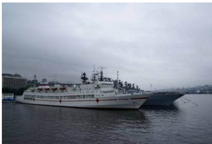
Корабельная набережная во Владивостоке