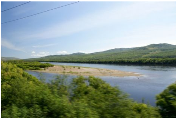
Необъятные просторы нашей Родины из окна поезда Томск-Владивосток