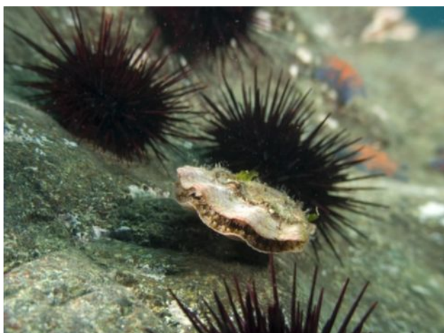
Гребешок Свифта в окружении чёрных ежей. о. Карамзина