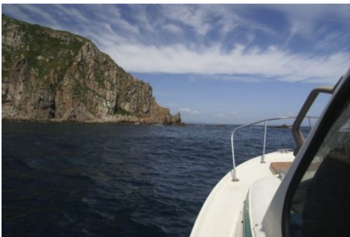
Вид с борта лодки. о. Стенина

Живописный ландшафт, кристально чистая вода моря, экзотические растения и животные. Мы там так расслабились, что даже не радовала перспектива второго погружения, которое