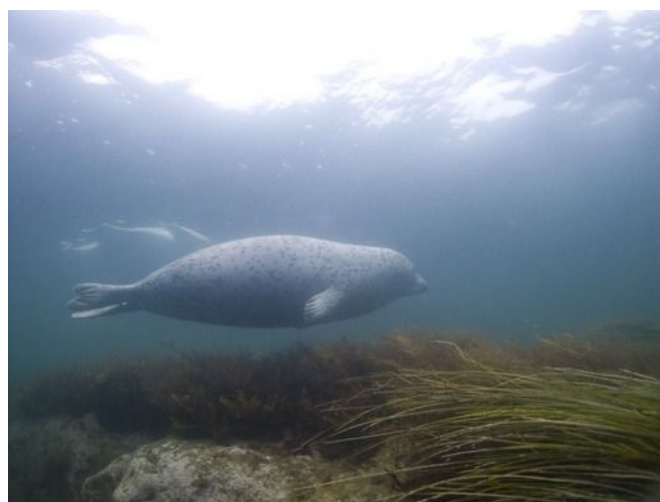
Пятнистый тюлень (ларга)