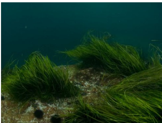
Подводная растительность о. Желтухина