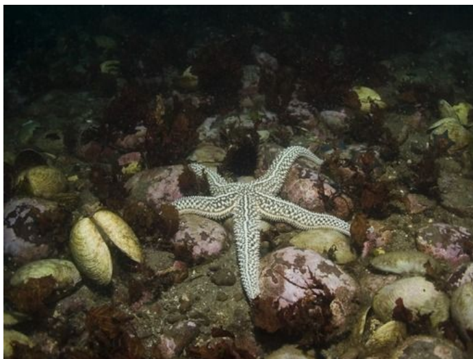
Дно близ о. Стенина. Звезда дистоластерия колкая