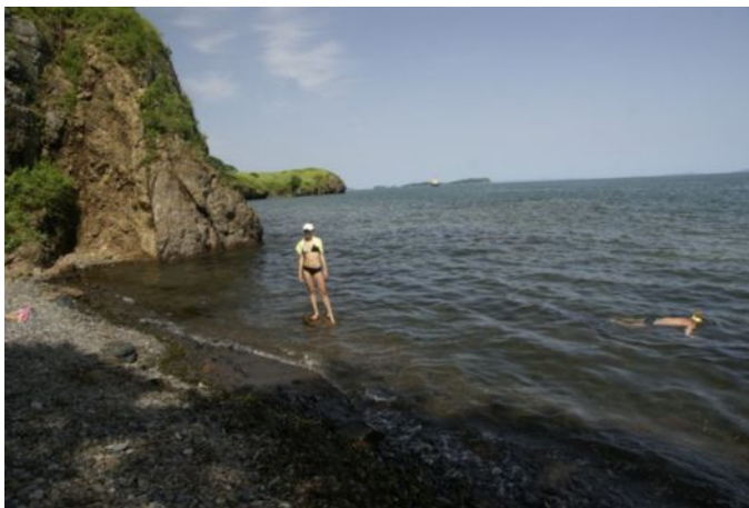
Выходной день. Сбор сувениров. б. Славянка