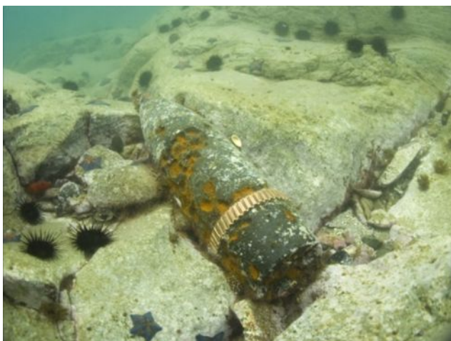
Отстреленный артиллерийский снаряд, пролетевший мимо цели

ландшафту! Создал эскизы для художественных фотографий. Было очень красиво! На обратном пути он собрал всех трепангов, которых показал в начале. Мы выбрались, перевесили баллоны, собрали снарягу и доехали до кекура Колонны. Потихоньку подошли, насколько можно близко и увидели нежащихся на камнях нерп! Приглядевшись, заметили их мордочки и в воде. Костя фотографировал, а мы поднимали со дна лодки свои челюсти. Володя сказал, что сегодня их еще никто не напугал, вот они и видны так хорошо. Мы плюхнулись в воду и поплыли. Дошли до мели, глубина 0,5-1 метр, но такое течение, что нас полоскало словно тряпочки. Было очень тяжело пробираться вперед, особенно, пока были голые камни. И тут, вот она... Выплыла нерпа! Я затаила дыхание, боясь, что пузыри могут ее спугнуть. Тут выплыла вторая.