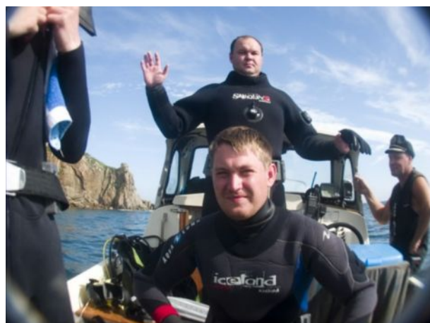
На борту судна между погружениями.