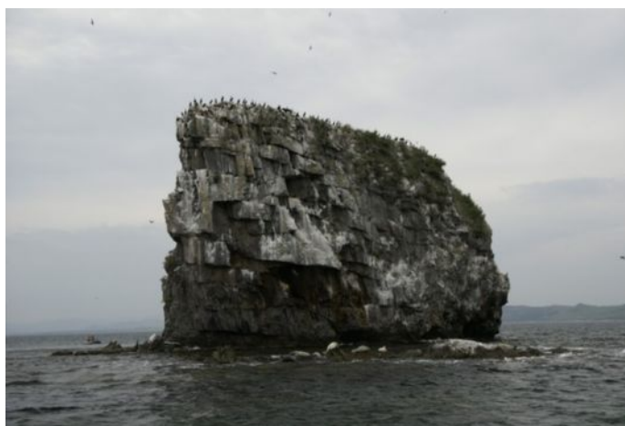
Кекур Колонна – обиталище пятнистых тюленей